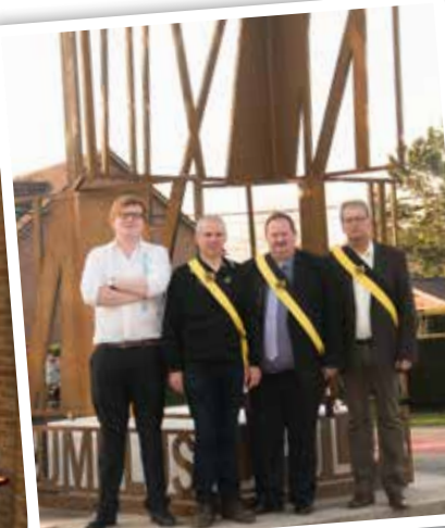
Onthulling 9e kunstwerk Kunstenparcours Opwijk.