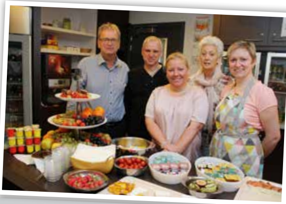
Mandatarissen verwennen medewerkers met ontbijt.