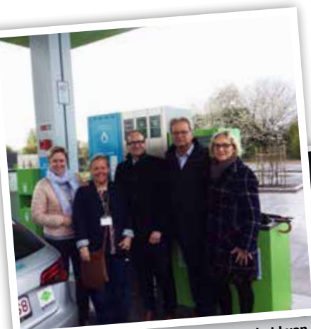
Opening CNG tankstation in aanwezigheid van minister Ben Weyts.