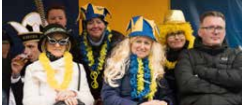
N-VA Opwijk-Mazenzele in beeld p.2