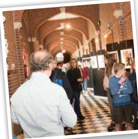
Opening WAK in klooster.