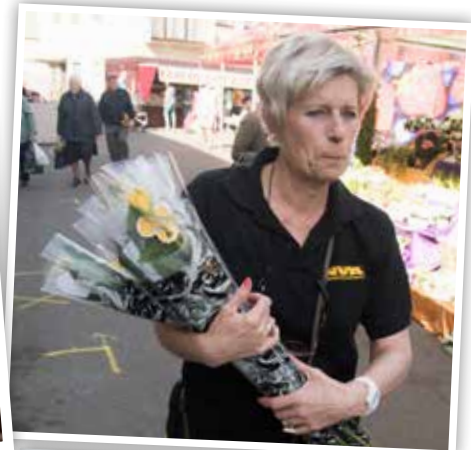
Moederdagactie op vrijdagmarkt.