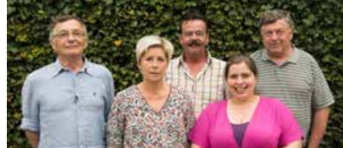
Nieuwe gezichten bij bestuur p.3