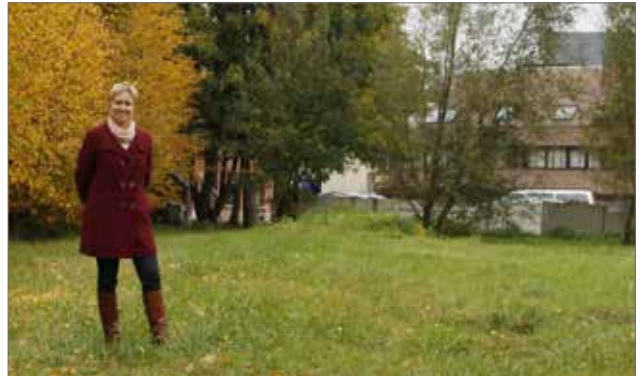
▲ Een dossier waar we terecht fier op zijn is dat van de Borchtsite. We vrijwaarden een stukje open ruimte in het centrum op de grond van de Fata Morgana.