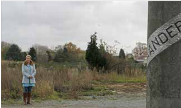
▲ De bedrijvzone De Vlaamse Staak is bijna volledig af. Hierdoor geeft de gemeente ruimte aan lokale ondernemers om zich in Opwijk te vestigen en ontwikkelen.

Vanuit het gemeentebestuur zet de N-VA in op een gemeente waar bedrijven kunnen ondernemen, waar er ruimte blijft voor groen en waar het afvalbeleid recyclage hoog in het vaandel draagt.