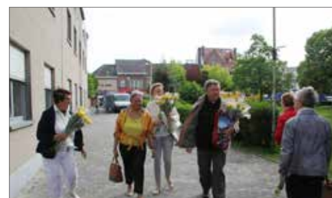
▲ Op Moederdag zette N-VA Opwijk de mama's letterlijk in de bloemetjes.