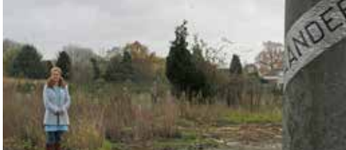
Opwijk: bedrijving, groen en proper p.2