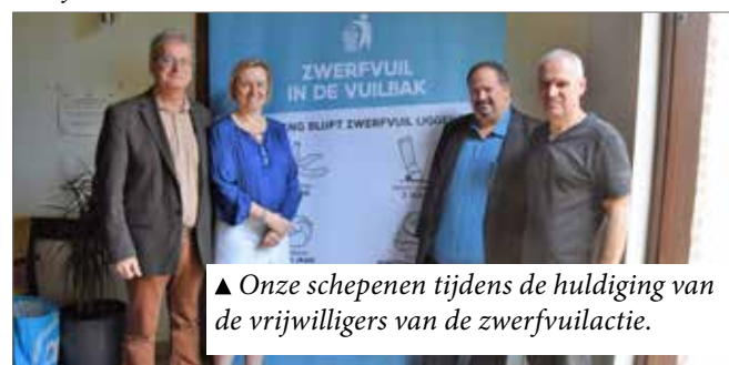
▲ Onze schepenen tijdens de huldiging van de vrijwilligers van de zwerfvuilactie.