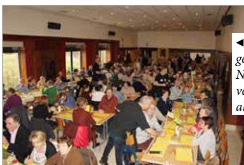
◀ Naar jaarlijkse gewoonte lokte het N-VA-eetfestijn weer veel volk. Bedankt aan alle aanwezigen!