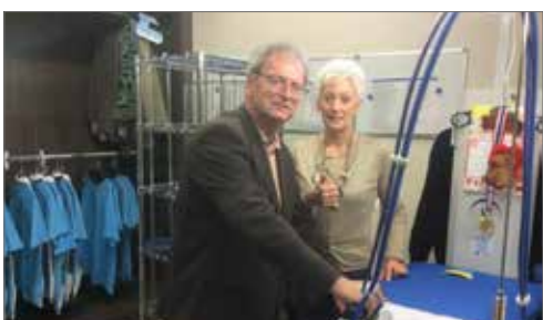
▲ Ook de N-VA was aanwezig bij de opening van het strijkatelier.