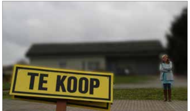
▲ Dankzij de verwervingspremie bieden wij meer mogelijkheden voor onze lokale jongeren om een eigendom in eigen gemeente te verwerven. Tevens zorgen wij door aangepaste stedenbouwkundige verordeningen dat Opwijk opnieuw leefbaar wordt.