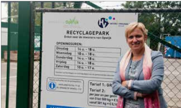
▲ Een verantwoorde prijs voor het recyclagepark en de wekelijkse ophaling van de restfractie in de zomer zorgen voor een goede aanpak van afval in de gemeente.