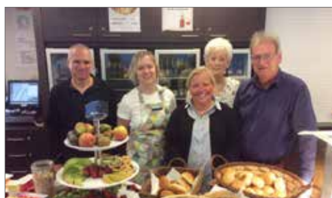
▲ Om de medewerkers van de gemeente en het OCMW te bedanken voor hun dagelijkse inzet, organiseerden we een ontbijt voor hen.