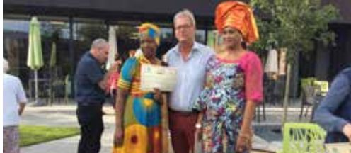
Lessen Nederlands voor anderstaligen p. 2