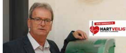
Welzijn en kwaliteitsvolle zorg p. 2 en 3