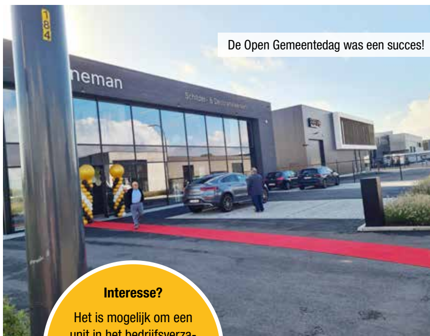
De Open Gemeentedag was een succes!

Door de goede samenwerking tussen de gemeente, POM Vlaams-Brabant, de intercommunale Haviland en het Regionaal Landschap Brabantse Kouters verliep het project vlot. Ondertussen zijn er vijftien lokale bedrijven gehuisvest.